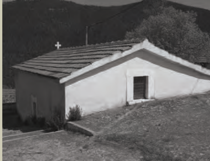
Εξωτερικές όψεις του μνημείου πριν και μετά τις εργασίες αποκατάστασης Facades of the church before and after the restoration