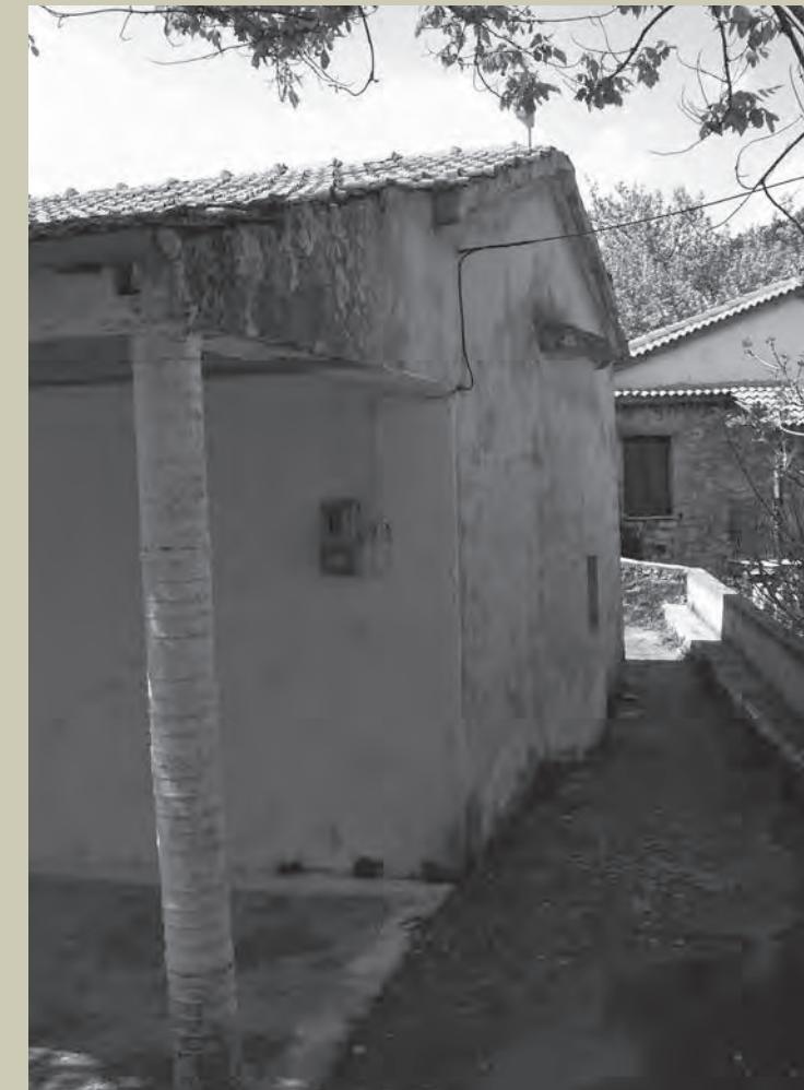
Άποψεις του ναού πριν από τις εργασίες αποκατάστασης και της διαμόρφωσης του περιβάλλοντος χώρου Views of the church before the restoration and the landscaping works