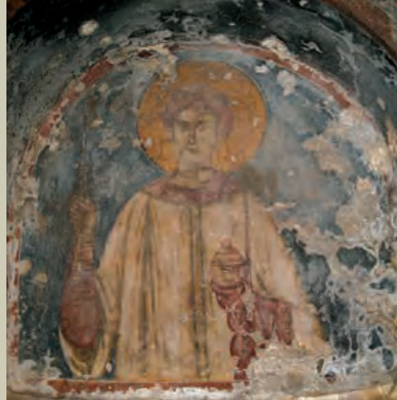
Αψίδα Προθέσης. Ο Άγιος Στέφανος πριν και μετά τις εργασίες συντήρησης Apse of the Prothesis. Saint Stefan before and after the conservation works