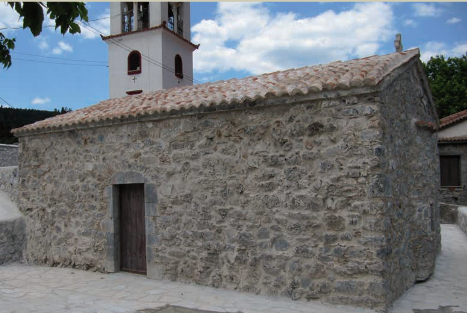
Νοτιοανατολική άποψη του ναού μετά τις εργασίες αποκατάστασης και της διαμόρφωσης του περιβάλλοντος χώρου Southeast view of the church after the restoration and the landscaping works