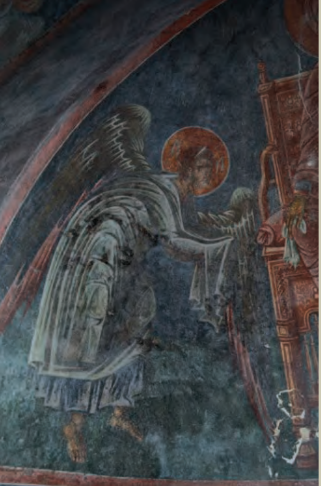
Αγίδα ιερού βήματος. Η παράσταση της enthroned Βρεφοκρατούσας Θεοτόκου ανάμεσα στους δύο Αρχαγγέλους, μετά τις εργασίες συντήρησης Apse of the sanctuary. Enthroned Virgin with the Child flanked by the two Archangels. After the conservation of the wall painting

Ο ναός, παρά την απλή αρχιτεκτονική του μορφή, συνιστά ένα από τα σημαντικότερα μνημεία της ευρύτερης περιοχής, λόγω της σπουδαιότητας του πρώτου στρώματος ζωγραφικής που καλύπτει τμήμα των εσωτερικών επιφανειών του. Η αρχική φάση τοιχογράφησης αναπτύσσεται στους χώρους του ιερού βήματος, στους πλάγιους τοίχους και σε τμήμα της ημικυλινδρικής καμάρας. Στο τεταρτοσφαίριο της κόγχης δεσπόζει η enthroned βρεφοκρατούσα Θεοτόκος ανάμεσα στους δύο Αρχαγγέλους.