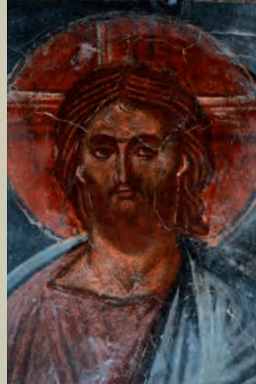
Νότιος τοίχος. Η παράσταση της Δέησης. Γενική άποψη και λεπτομέρεια του Χριστού South wall. The scene of Deesis. General view and detail of the figure of Jesus Christ

Οι τοιχογραφίες του πρώτου στρώματος της Παναγίας Ροεινού διακρίνονται για την εξαιρετική τους ποιότητα, τα εντυπωσιακά χρώματά τους, καθώς επίσης και την εκφραστική δύναμη και την ευχέρεια στην απόδοση των μορφών. Συνιστούν έργο ενός φημισμένου εργαστηρίου ζωγράφων, ενήμερου για τις νεωτερικές τάσεις της μνημειακής ζωγραφικής των Παλαιολόγων κατά το δεύτερο μισό του 14ου αιώνα. Το σημαντικότερο έργο του συγκεκριμένου εργαστηρίου συνιστούν οι τοιχογραφίες της εκκλησίας του Αγίου Γεωργίου στον Λογανικό Λακωνίας, χρονολογημένες με επιγραφή το έτος 1374/75, όπου η επίδραση των καλλιτεχνικών εξελίξεων στον γειτονικό Μυστρά είναι πρόδηλη. Έργο της μεταβυζαντινής εποχής αποτελούν οι τοιχογραφίες του κτιστού τέμπλου της εκκλησίας του Ροεινού, που φιλοτεχνήθηκαν, σύμφωνα με επιγραφή, κατά το έτος 1591/92 από τον ναυπλιαίο ζωγράφο Δημήτριο Κακκαβά.