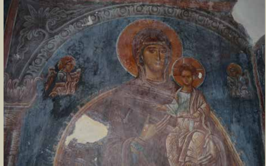
Βόρειος τοίχος. Η προσκυνηματική παράσταση της enthroned Βρεφοκρατούσας Θεοτόκου North wall. The representation of the enthroned Virgin with the Child

Χαμηλότερα εικονίζεται η παράσταση του Μελισμού, προς την οποία στρέφονται τέσσερις συλλειτουργούντες ιεράρχες. Ψηλά στον ανατολικό τοίχο παριστάνεται ο Ευαγγελισμός, ενώ στο μέτωπο της αψίδας εικονίζεται σε μέταλλιο ο Παλιός των Ημερών. Τον διάκοσμο του ιερού βήματος συμπληρώνουν διάκονοι και ιεράρχες. Στο ανατολικότερο τμήμα της καμάρας παριστάνεται η σκηνή της Ανάληψης. Η υπόλοιπη καμάρα διακοσμείται με σκηνές του Χριστολογικού και του Θεομητορικού κύκλου, οι περισσότερες εκ των οποίων έχουν επιζωγραφιστεί κατά τη μεταβυζαντινή εποχή. Η παράσταση της Δέησης στο ανατολικό πέρασ του νότιου τοίχου του κυρίως ναού εντυπωσιάζει με την άριστη κατάσταση διατήρησής της, ενώ πολύ καλά σώζονται επίσης η enthroned βρεφοκρατούσα Θεοτόκος στην αντίστοιχη θέση του βόρειου τοίχου και η όρθια μορφή του αγίου Ιωάννη του Προδρόμου στα αριστερά της. Η ζώνη με τους ολόσωμους αγίους στην κατώτερη στάθμη των πλάγιων τοίχων έχει καταστραφεί ολοσχερώς.